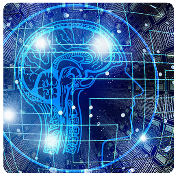
Exclusive FuzzyScan Imaging Technology