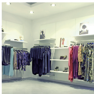
Venda a retalho