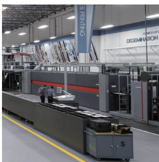
Centro di distribuzione