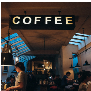
Hotelaria e restauração