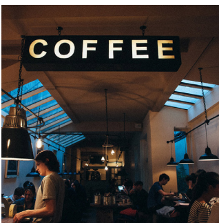
Industrie de l'accueil