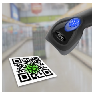
Puntero verde afilado