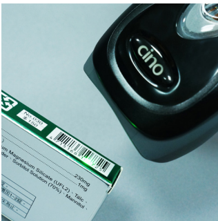
In der Nähe von Contact Reading